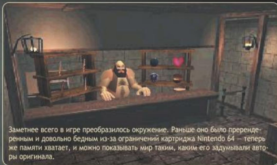
Заметнее всего в игре преобразилось окружение. Раньше оно было пререндеренным и довольно бедным из-за ограничений картриджа Nintendo 64 — теперь же памяти хватает, и можно показывать мир таким, каким его задумывали авторы оригинала.