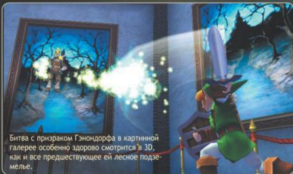
Битва с призраком Гэондорфа в картинной галерее особенно здорово смотрится в 3D, как и все предшествующее ей лесное подземелье.