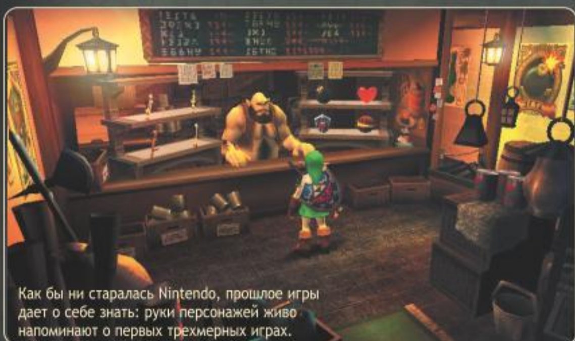
Как бы ни старалась Nintendo, прошлые игры дает о себе знать: руки персонажей живо напоминают о первых трехмерных играх.

риментировать, чтобы решать головоломки и тем самым продвигаться по сюжету. Зачастую приходится делать похожие вещи, но никогда не приходится делать одно и то же несколько раз: в «Окарине» каждому предмету находится не одно применение, а когда запас приемов заканчивается, игра вновь меняется, давая возможность, например, покататься на лошади или разучить пару мелодий на окарине.